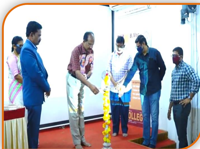
Lighting the lamp by dignitaries