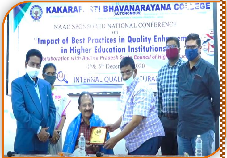
Felicitation to the Chief Guest