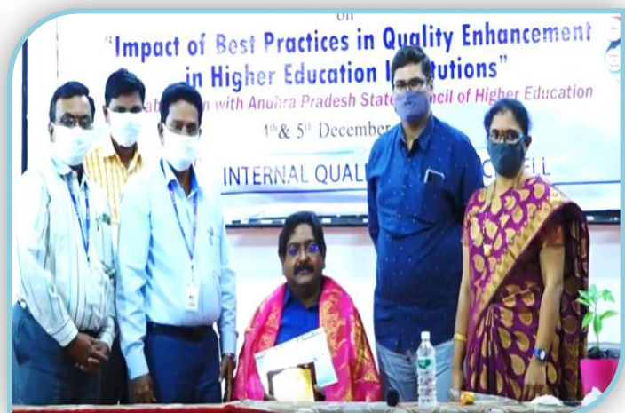
Felicitation to the Chief Guest